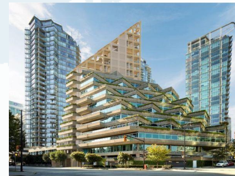
Vancouver. il grattacielo Terrace House firmato dall'architetto Shigeru Ban, vincitore del Premio Pritzker, è l'edificio in legno più alto del mondo (71 metri)