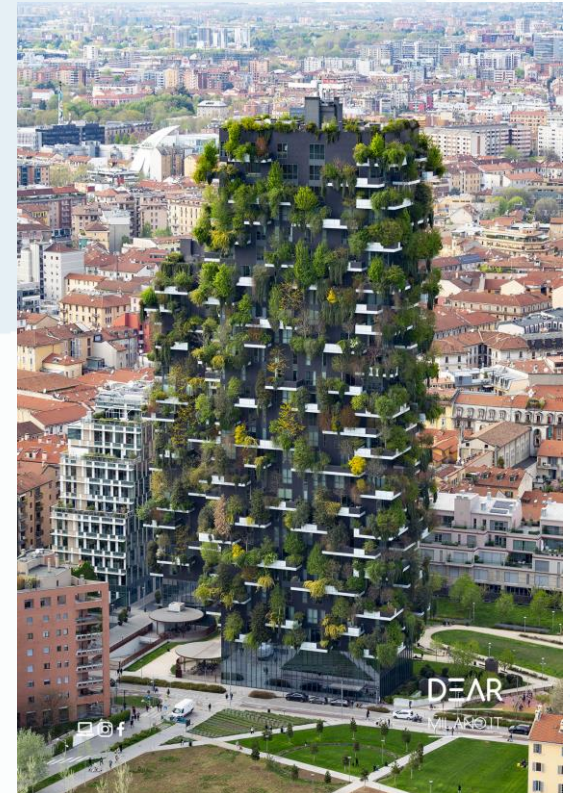
Milano | Bosco verticale

2.5 Estimo, sviluppo urbano sostenibile e valore connesso al «ciclo di vita» ex lettera hhhh), comma 1, art. 3, del D.Lgs. 50/2016 (c.d. «Codice Appalti»). Life-cycle assessment (LCA)